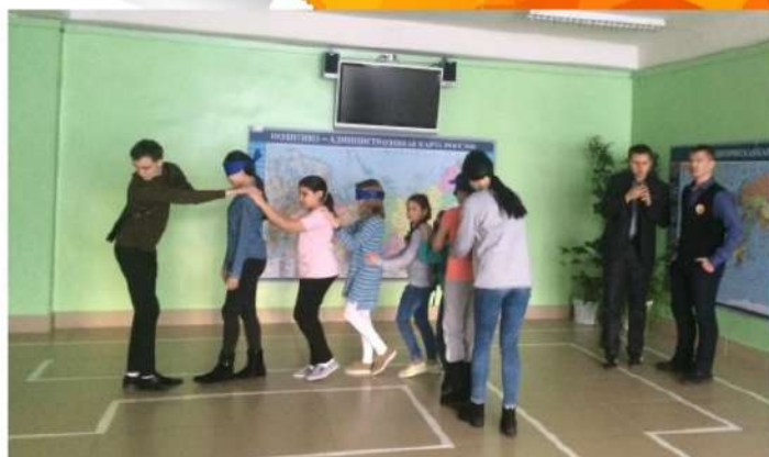
Занимались досугом наших младших друзей на квестах, представлениях, веселых переменках