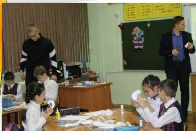
Мы проводили уроки у младших школьников — знакомили их с Листом Мебиуса