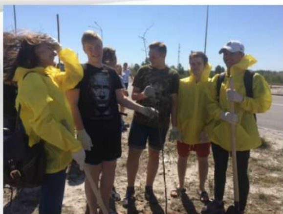
Озеленение улиц нашего города— экологическая акция