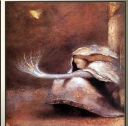
Арахна, превращающаяся в паука